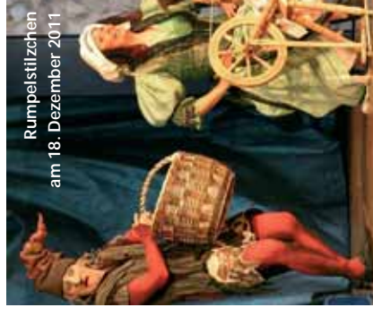
Rumpelstilzchen am 18. Dezember 2011

Abonnement und Eintrittskarten sind im Vorverkauf zzgl. 10% Vorverkaufsgebühr nur bei Zigarren Fries in der Bergedorfer Straße 46, Telefon 04152 / 3372, erhältlich.